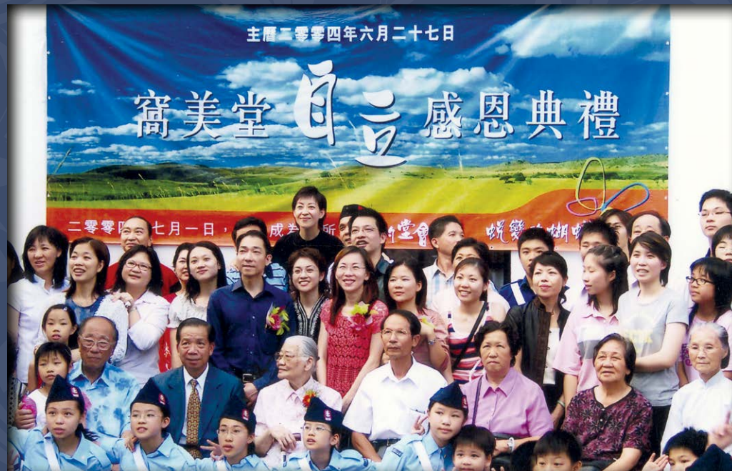
“2004年6月27日舉行「自立感恩典禮」，窩美堂於同年7月1日正式自立”