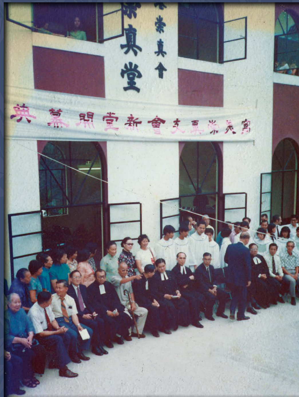
“1974年6月新堂終於建成， 7月7日舉行開幕典禮”